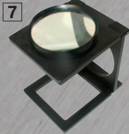
7 ЛУПА СТ-7055,