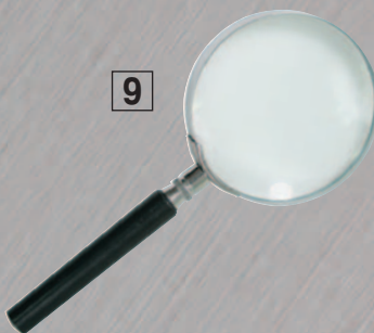
9 ЛУПА СТ-7025А,