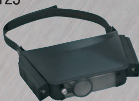
12 ЛУПА 2x100

Складная лупа для работы с мелкими деталями, Ф100x3 мм. Возможность складывания позволяет укомплектовывать ею кейс с инструментами для работ на выезде, а дополнительный шарнир дает дополнительные возможности регулировки.