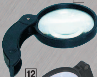
11 ЛУПА ЛПК-471