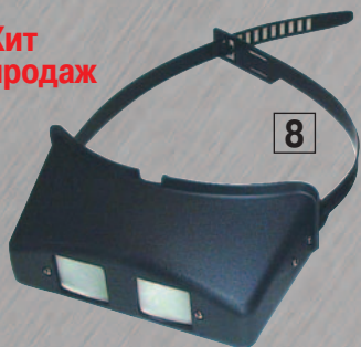
8 ЛУПА БЛ-2

Полезное приспособление для объемного наблюдения мелких предметов. Применяется при пайке мелких деталей, в медицине, криминалистике, точной механике, моделировании. С помощью раздвижного обода лупа легко и удобно закрепляется на голове и может быть надета даже поверх очков. В прорези для глаз установлены линзы. Регулируемые точки опоры позволяют сдвигать лупу на лоб. Данная лупа обеспечивает 5-ти кратное увеличение.