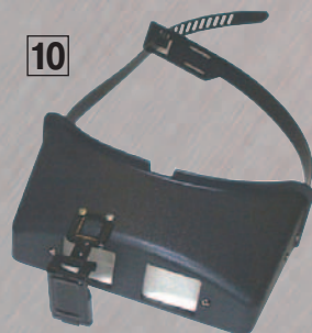
10 ЛУПА БЛ-2-1, ПЯТИКРАТНАЯ

Предназначена для работы с мелкими деталями, удобна в эксплуатации так как одевается на голову и не занимает рук. Лупа выполнена в виде козырька на глаза. В прорези для глаз установлены линзы. Перед линзой правого глаза установлена дополнительная линза, позволяющая при ее опускании увеличивать кратность до пяти.